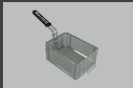
Ref. 907045 CESTA REFORZADA FA 8/10